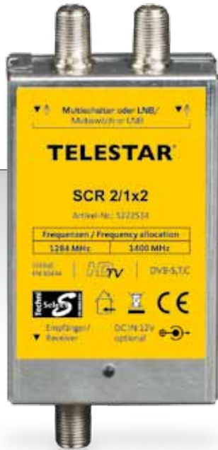
TELESTAR SCR 2/1x2 Art.Nr.: 5222534 EAN 40 24035 22534 0

TELESTAR Multischaltern der STARSWITCH Serie sowie weiteren Multischaltermodellen anderer Hersteller. Zusätzlich kann der SCR 2/1x2 auch direkt an den beiden Ableitungen eines Twin-LNBs bzw. an 2 Ausgängen eines Quatro-Switch-LNBs verwendet werden.